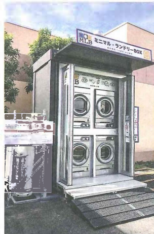
▲スピンドルが開発した小型ランドリー「ミニマル・ランドリーBOX（ボックス）」。狭いスペースでも設置可能

「新たに需要が高まっているエリアとして、都心部が挙げられる。特に高層のタワーマンションは規則で洗濯物をベランダに干すことができない場合が多く、周辺のコインランドリーの利用率が上がる」（吉野社長）