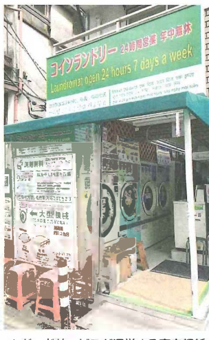
▲グッドサービスが運営する東京都新宿区の店舗。5坪の土地に所狭しと機器が並ぶ

一般的なコインランドリー店舗の規模と初期投資額 ●店舗面積：10～30坪 ●機器数：洗濯機・洗濯乾燥機5～10台＋乾燥機5～10台（平均として合計15台前後） ●初期投資額：2000万～3000万円 ※建物の建設費用は含まない